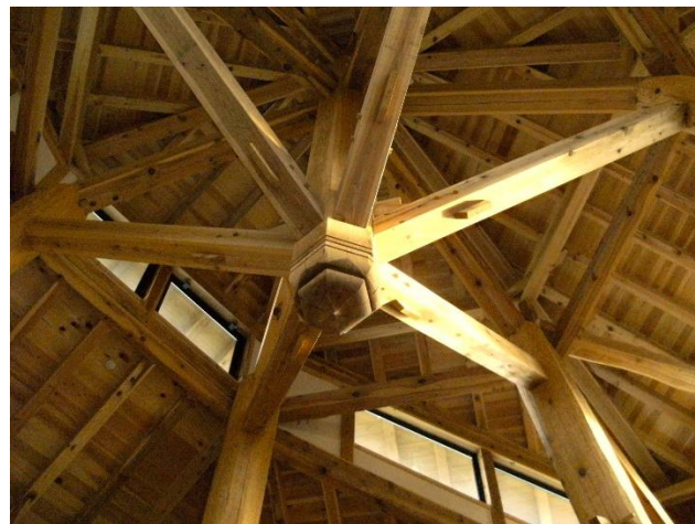
多目的ホール(中央：心柱 放射状の傘の芯)