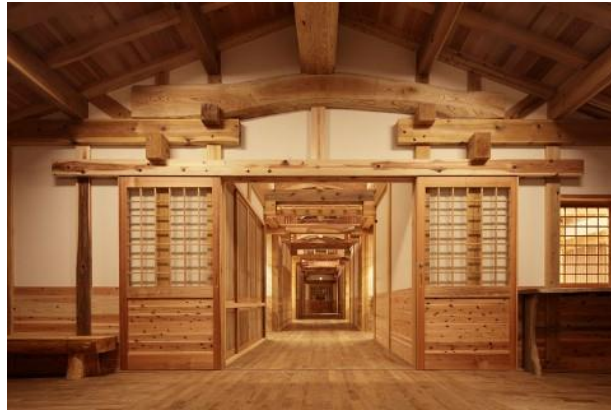
守る棟から活かす棟方向