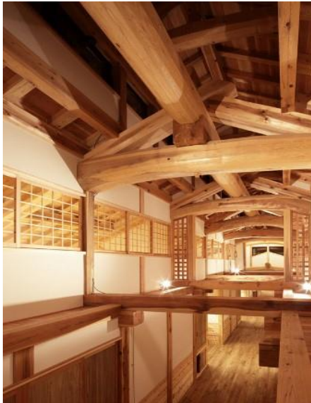
活かす棟 廊下天井