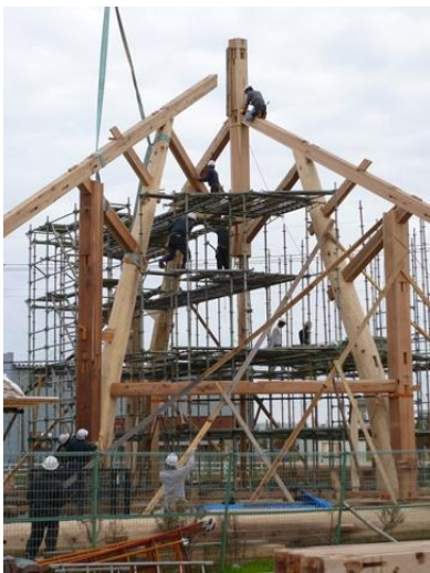
建て方 (多目的ホール)