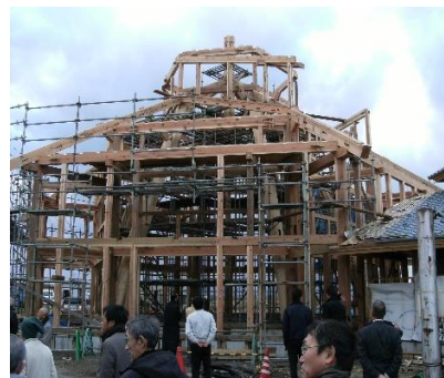
建て方 (多目的ホール)