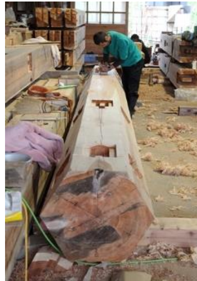
墨付け(心柱 直径 53 cm)