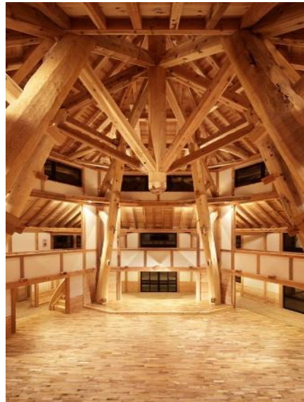
多目的ホール(夜撮影)